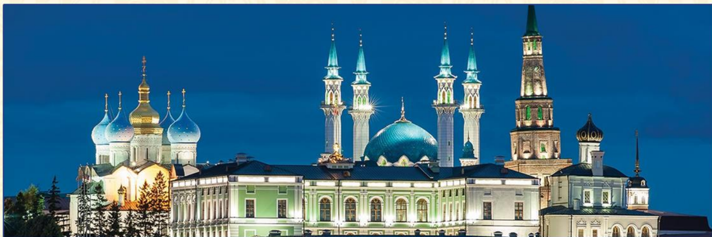
В Казанском Кремле стоят рядом мечеть Кул-Шариф и православные храмы.

- в архитектуре - схожесть христианских и исламских куполов и сводов, которые создают ощущение небесного пространства, а богатство интерьеров – величия.